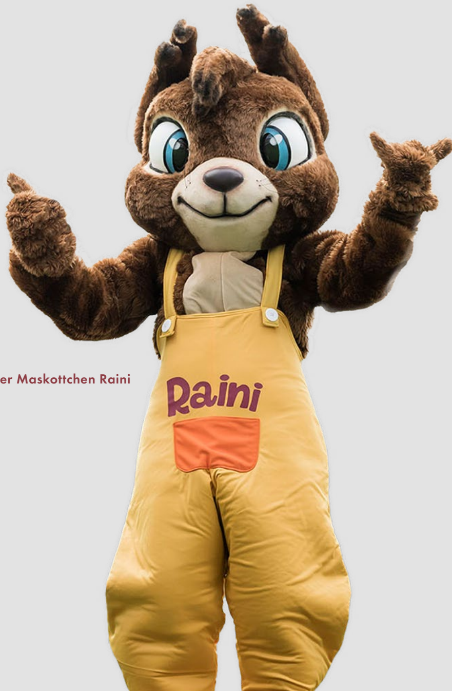
Unser Maskottchen Raini